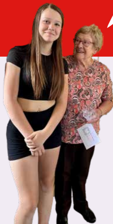
Lief en Leed aan de deur met leerlingen van Terra Nigra PRO

op hun eigen manier actief zijn. De bestaande Lief & Leedstraten worden uitgedaagd om in deze periode ook aandacht te besteden aan ontmoeting en contact. Natuurlijk zijn de dorpsbezoeken ook geschikt voor voor een praatje, het geven van informatie of om bijvoorbeeld om nieuwe initiatieven te werven.